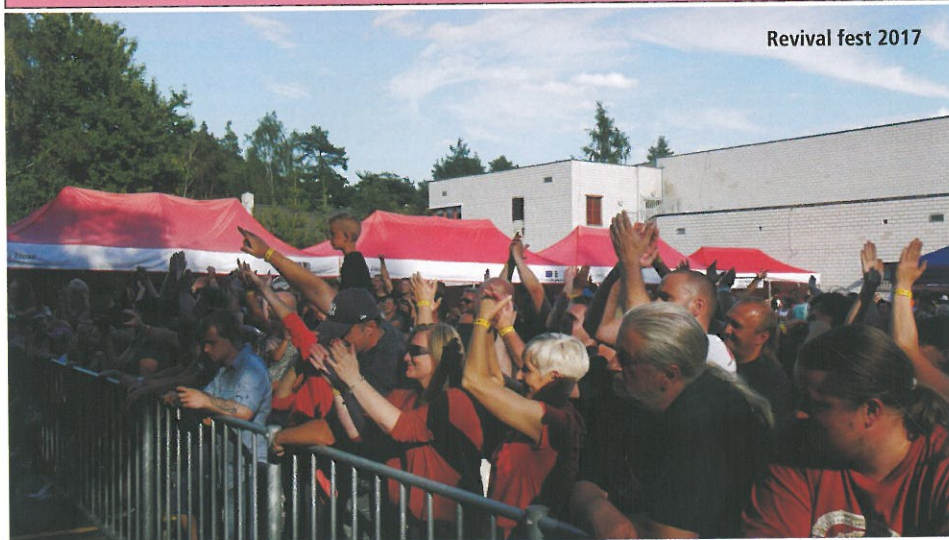
Revival fest 2017