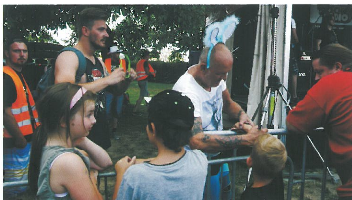
Foto report z Revival festu 201 , návštěvnický nejúspěšnější akce všech dob v Konstatinkách, 708 lidíček