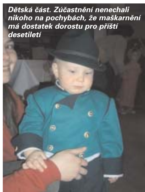
Dětská část. Zúčastnění nenechali nikoho na pochybách, že maskarnění má dostatek dorostu pro příští desetiletí