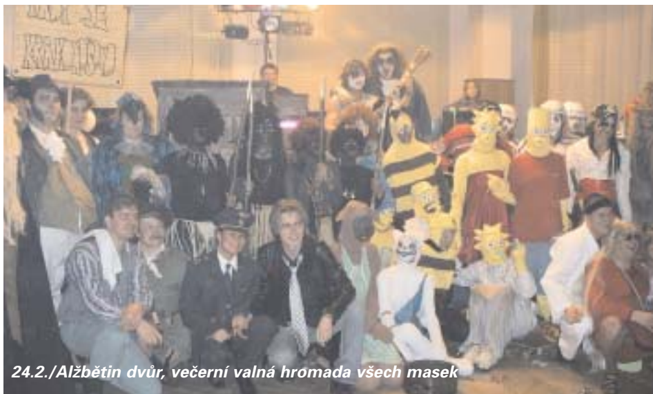
24.2./Alžbětin dvůr, večerní valná hromada všech masek