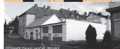
FOTOGRAFIE STÁVAJÍCÍ HASIČSKÉ ZBRONICE

STÁVAJÍCÍ OBSLUŽNÁ KOMUNIKACE BUDE UPRÁVENA A VYUŽITA PRO ZÁSODOVÁNÍ POLYFUNKČNÍHO DOMU. ZÁROVEŇ BUDE SLouŽIT PRO PŘÍJEZD KE STÁVAJÍCÍM ŘADOVÝM GARÁŽÍM A VZNIKNOU ZDE NOVÁ PARKOVACÍ MÍSTĚ. PRO LEPŠÍ DOPRAVNÍ OBSLUŽENOST DANÉHO ÚZEMÍ BY BYLO VHODNĚ TUTO KOMUNIKACI PRODLouŽIT, MEZI PANELOVÝMI DŮMY AŽ K ULICI ZÁHRADNÍ. NOVÁ ČÁST BUDE JEDNOMĚRNĚ KOMUNIKACE S JEJÍM JÍZDNÍM A JEJÍM OSTATNÝM PRUHEM, VYUŽITÝM PRO PODELNĚ PARKOVÁNÍ.