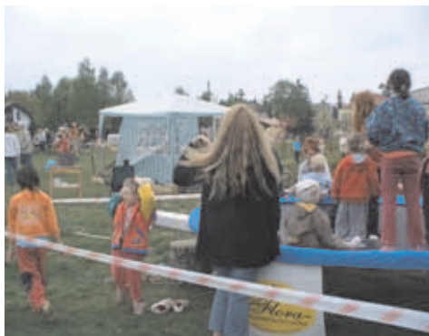
velký zájem nejmenších upoutala tram- polína