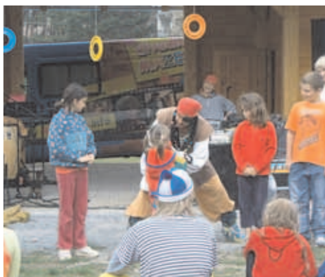
divadlo Mazec pobavilo a vtáhlo do děje své show každého