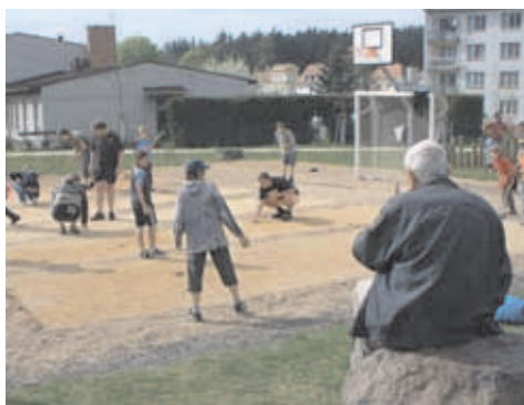
hrály a fandily všechny věkové kategorie