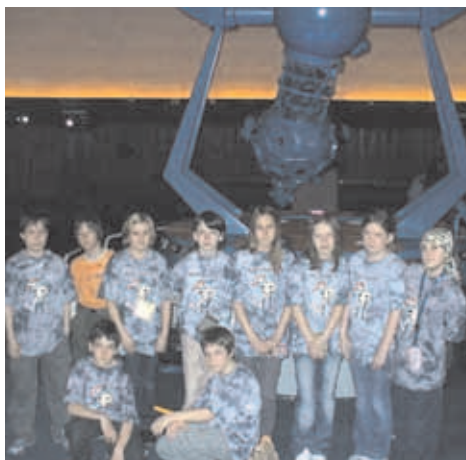
Začátek dubna udělal radost žákům 5. ročníku. Uskutečnila se dlouho připravovaná exkurze do Prahy.