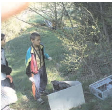
Počasi nám přálo i 22. dubna, kdy jsme si připomněli Den Země. Jako každý rok jsme vyrazili vyzbrojeni igelitovými rukavicemi a pytlí do přírody, abychom ji zbavili odpadků. Tentokrát jsme vyčistili část naučné stezky vedoucí ke Studánce lásky, mladší žáci se soustředili na školní zahradu a okolí školy.