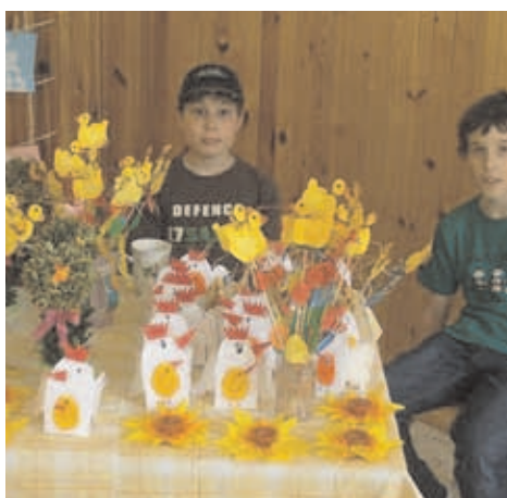
Pro celou školu byl svátkem 8. duben, kdy se konal Velikonoční jarmark.