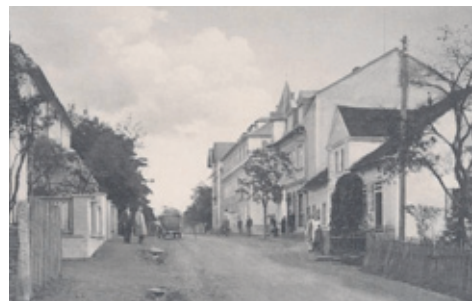
V předu napravo - zemědělská usedlost čp.24 - foto z cca 1928