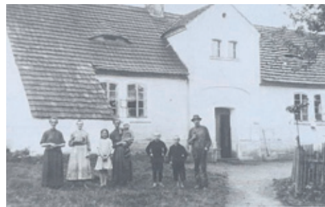
Zemědělská usedlost čp.25 s rodinou Schreilvogelových