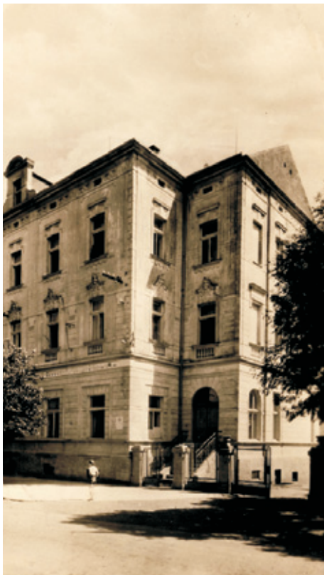
 p. 47 - lzeňsk dm Mj foto z roku cca 1960

Pouňorová historie hotelu čp. 47 Caf  Continental pokra ovn z minulho vydn