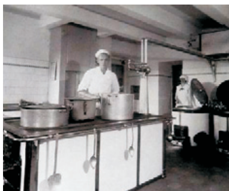
Kuchyně Ozdravovny - r. 1935

Poslední razítko Léčebného domu Podpůrného spolku haléřového